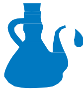
oli de cuina

... una part es ven a les botigues de segona mà a preus molt reduïts i la resta es recicla o es gestiona com a residu.